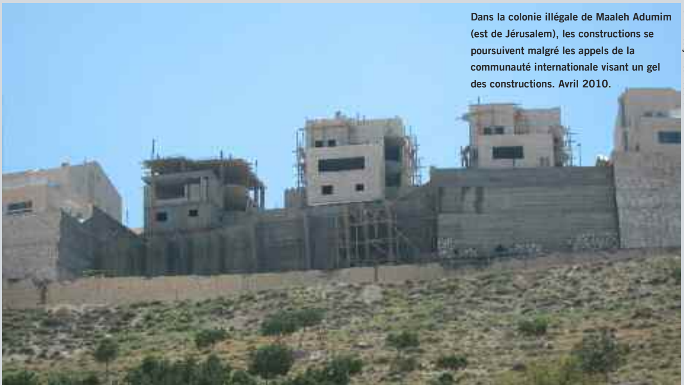
Dans la colonie illégale de Maaleh Adumim (est de Jérusalem), les constructions se poursuivent malgré les appels de la communauté internationale visant un gel des constructions. Avril 2010.